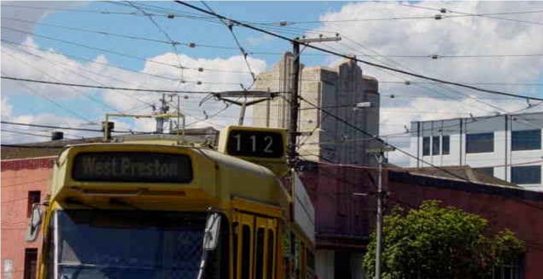
Z-Class Vierachser mit Pantograph an der Victoria Parade

Die meist engen Kurven weisen eine Vielzahl von bis zu 12 Querspannern auf, an denen die Fahrdrähtklemmen alle starr aufgehängt sind. Insbesondere bei Verzweigungen verträgt sich die Vielzahl der Drähte und Fahrleitungen nur schlecht mit einem ansprechenden Stadtbild.