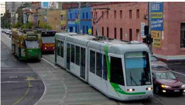
Drei Tramgenerationen in Melbourne: links ein grün-gelb gestrichener Vierachser der Z-Class aus den Siebzigerjahren, vorne rechts ein niederfluriger, anfangs dieses Jahres abgeliefertes vierachsiges(!) Gelenktram Citadis und in der Mitte ein zwischen 1984 und 1994 erbautes sechsachsiges Gelenktram (B1-Class)

Bis vor kurzem setzte sich die Fahrzeugflotte hauptsächlich aus über vierhundert alleinfahrenden hochflurigen vier- und sechsachsigen Trams zusammen, welche ab Mitte der Siebzigerjahre beschafft wurden. Seit Mitte 2001 werden bis Mitte 2003 95 neue Niederflurtramwagen abgeliefert, welche die älteren hochflurigen Trams ergänzen und teilweise ersetzen.