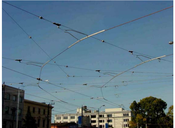
Neue K+M Kurvenfahrleitung mit Kurvenschienen für Trolley- und Pantographbetrieb, kurz nach deren Einbau an der Victoria Parade