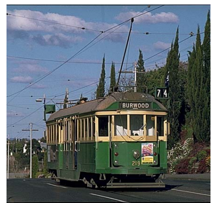
1923 erbauter Mitteleinstiegs-Vierachser(W2-Class) in Burwood